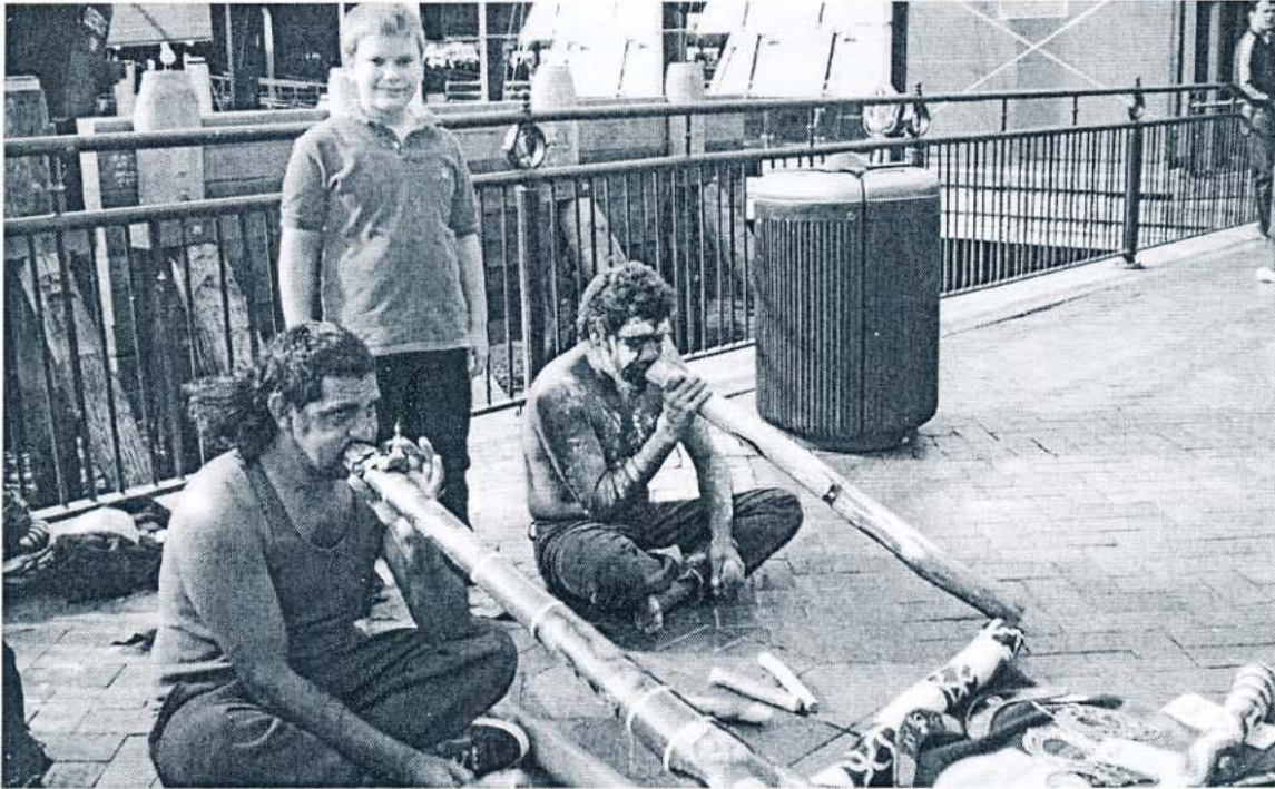
Aborigines – Ureinwohner Australiens

Um alles zu sehen, müsste man mindestens 2 Wochen bleiben. Leider hatten wir nicht die Zeit. Wir blieben 3 Tage und gaben 3 Konzerte. Und schon ging's weiter Richtung Norden. Auf unserem Plan stand, dass wir in drei Tagen 2000 km schaffen müssen. Unsere deutschen Freunde blieben daher in Sydney und wir fuhren und fuhren mit 2 Übernachtungen und als besonderes Andenken erhielten wir ein Strafmandat, fürs Schnellfahren, die Polizisten in Australien sind da sehr streng. In Townsville angekommen hatten wir endlich einen Tag frei, den wir sofort nutzten für einen Ausflug auf eine Südseeinsel und auf das Barriereriff.