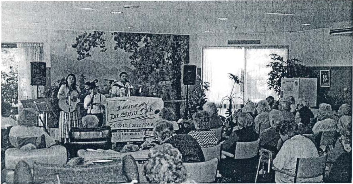
Auftritt in einem deutschsprachigen Seniorenheim

Nach Melbourne fahren wir Richtung Norden ca. 850 km in die Hauptstadt Australiens, nach Canberra. Dort waren wir in der österreichischen Botschaft eingeladen und sahen sehr viel von dieser Stadt.