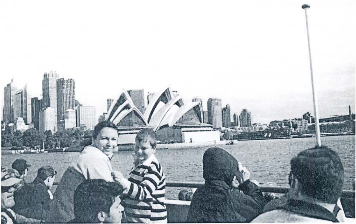
Opernhaus von Sydney

Auch dort spürten wir noch sehr den Winter. In der Nacht hatte es sogar Minusgrade. Wir freuten uns schon sehr auf die Fahrt weiter in den Norden nach Sydney. Viele meinten, dort wird's endlich wärmer. So war es auch. Sydney ist eine Weltstadt, mit einem wunderschönen Hafen, dem eindrucksvollen Opernhaus und der imposanten Harbourbridge.