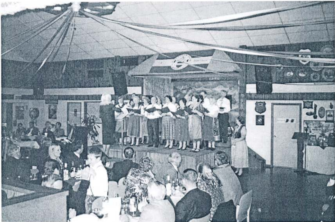
Österreichischer Chor in Sydney

Auch dort spürten wir noch sehr den Winter. In der Nacht hatte es sogar Minusgrade. Wir freuten uns schon sehr auf die Fahrt weiter in den Norden nach Sydney. Viele meinten, dort wird's endlich wärmer. So war es auch. Sydney ist eine Weltstadt, mit einem wunderschönen Hafen, dem eindrucksvollen Opernhaus und der imposanten Harbourbridge.