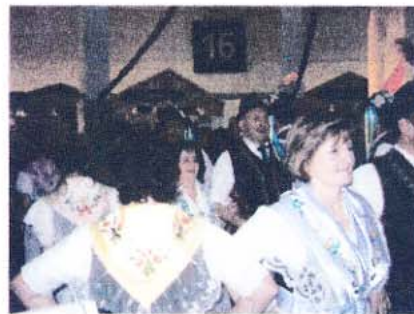
die Volkstanzgruppe „die Spreewälder“